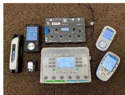
物療機器や検査機器等

機能解剖学やトリガーポイント等について学習し、臨床で活かせる解剖学の知識や、実践的な触診能力の向上を目指します。また、診療で活用する物理療法機器（各種低周波治療器等）や客観的評価機器（サーモグラフィ、自律神経検査機器等）についても実践的に学び、総合的な臨床能力の向上を目指します。