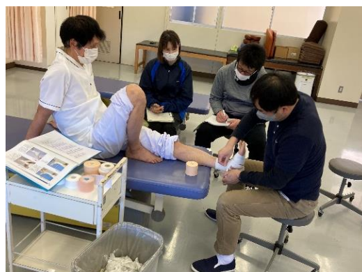
○ リハビリテーション医学