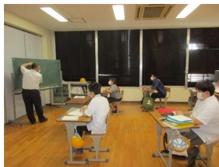
情報コースの授業の様子

情報コースは、あん摩マッサージ指圧師、はり師、きゅう師の国家資格取得を目指したカリキュラムで、専門基礎科目、専門科目からなっています。模擬試験も年7回程度実施しています。詳細については情報コースの教育課程を確認した上で、教育相談担当者までお問い合わせください。