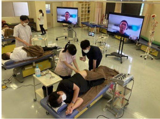
○ オンライン授業 (筑波技術大学)