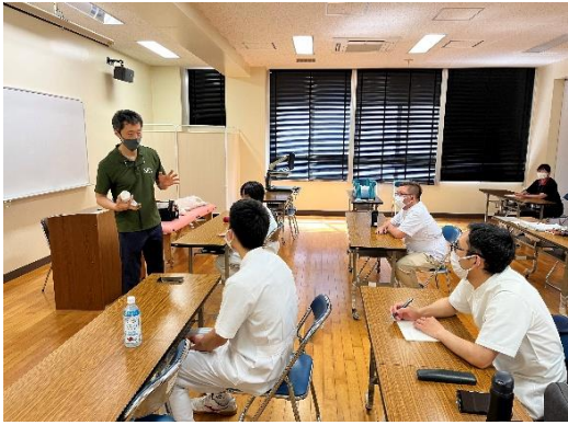
○ 整形外科 (スポーツ医学)