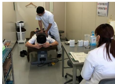
臨床能力評価の様子

臨床能力に関する総合的な評価を年2回実施します。評価結果に基づいて課題となる部分や目標を生徒と職員で共有し、課題の改善に向けた指導内容を取り入れることで、スキルアップを支援していきます。